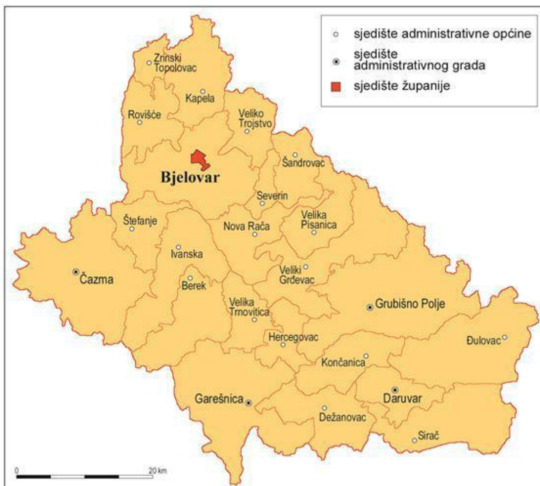
Slika 1.2. Karta Bjelovarsko-bilogorske županije s administrativnom podjelom (5)

Bjelovarsko-bilogorska županija sedma je od ukupno dvadeset županija uključujući grad Zagreb koji djeluje kao zasebna cjelina (5). Smještena je na istočnom dijelu središnje Hrvatske čime graniči s Koprivničko-križevačkom na sjeveru, Zagrebačkom na zapadu, Sisačko-moslavačkom na jugozapadu Požeško-slavonskom na jugu i Virovitičko-podravskom županijom na istoku. Površina županije iznosi 2.651 km 2 , a ukupan broj stanovnika iznosi 119.764 stanovnika ili 45 st./km 2 (prema zadnjem popisu stanovništva iz 2011. godine). Sjedište joj je u gradu Bjelovaru s time da se u županiji nalazi ukupno pet gradskih naselja u koje se ubrajaju Bjelovar, Čazma, Grubišno Polje, Garešnica i Daruvar, te 18 općina u koje se ubrajaju Berek, Dežanovac, Đulovac, Hercegovac, Ivanska, Kapela, Končanica, Nova Rača, Rovišće, Severin, Sirač, Šandrovac, Štefanje, Velika Pisanica, Velika Trnovitica, Veliki Grđevac, Veliko Trojstvo i Zrinski Topolovac (slika 1.2).