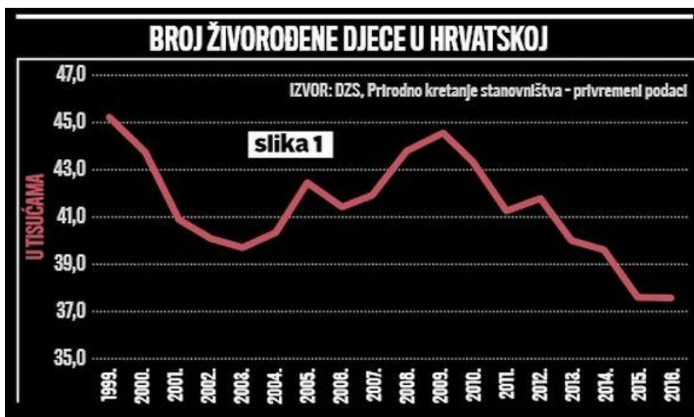
Slika 1.3. Broj živorođene djece u Hrvatskoj u razdoblju 1999. – 2016. (17)

Nakon 2009. godine, zabilježen je drastičan pad novorođene djece nastao uslijed gospodarske krize (17). Trenutno se zaustavio, što prikazuje slika 1.3, no oporavak još nije vidljiv. Kako su natalitet i broj prvašića u uskoj vezi, brojka novorođenih može se upotrijebiti pri analizi očekivane brojke upisane djece u prvi razred. Ukoliko se računa 75% djece rođene 2009. i 25% rođene 2010. (broj djece rođene u prva tri mjeseca godine koja kreću u školu ranije, ali unutar dobne granice), dobit će se maksimalan broj djece rođene unutar zemlje za koju se pretpostavlja kako će upisati prvi razred 2016. godine. U Hrvatskoj se tijekom razdoblja od jedne godine rodi otprilike 7000 manje djece nego što je to bio slučaj tijekom 2008.-2009. godine.