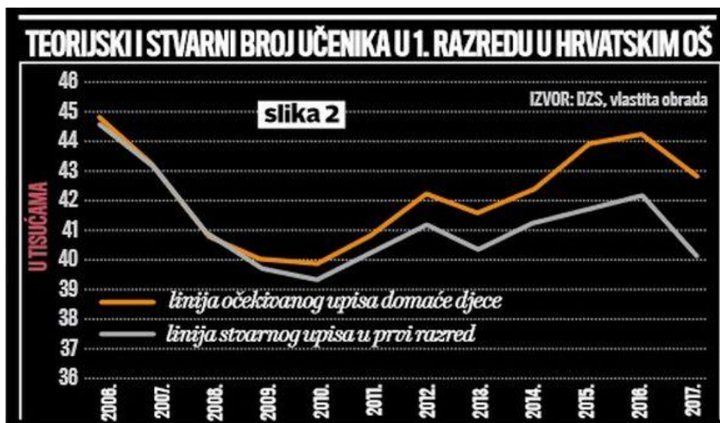
Slika 1.4. Teorijski i stvarni broj učenika u 1. razredu u hrvatskim osnovnim školama (17)

i ulazak u europske države, ali i u sve češćem odlasku mladih obitelji gdje privremena emigracija postaje stalna. Procjene pokazuju kako pad djece upisane u prvi razred osnovne škole nije izražen kao činjenica da se smanjuje broj rođene djece. Upravo je navedeno srž problema zbog kojega je prisutno smanjivanje ukupnog broja stanovništva Republike Hrvatske.