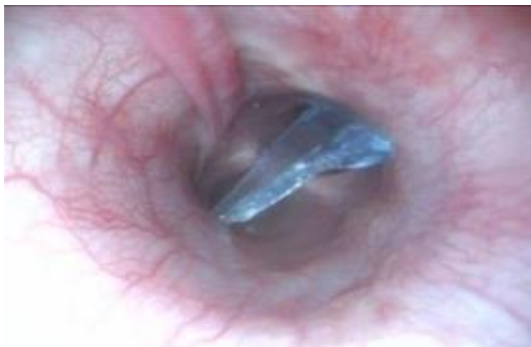
Slika 7.4. Strano tijelo u bronhu

Oralno uvođenje instrumenta je poželjnije zbog mogućnosti gubljenja stranog tijela u nosnim hodnicima nakon izvlačenja instrumenta i stranog tijela. Kirurške metode ostaju kao zadnja instanca i koriste se u svim slučajevima, a kada ostale metode nisu uspješne.