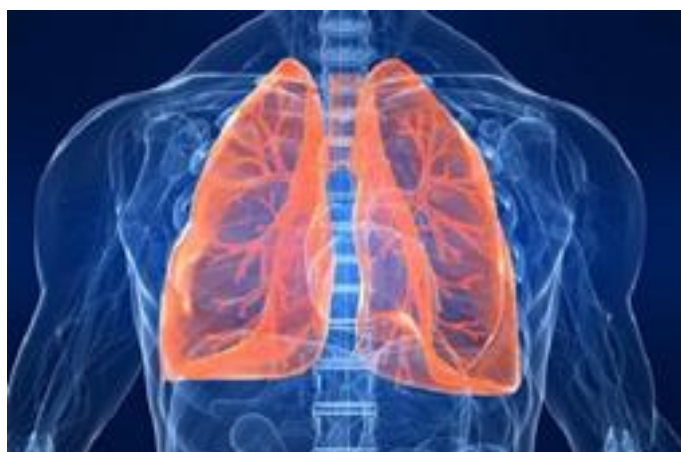
Slika 4. Anatomija pluća