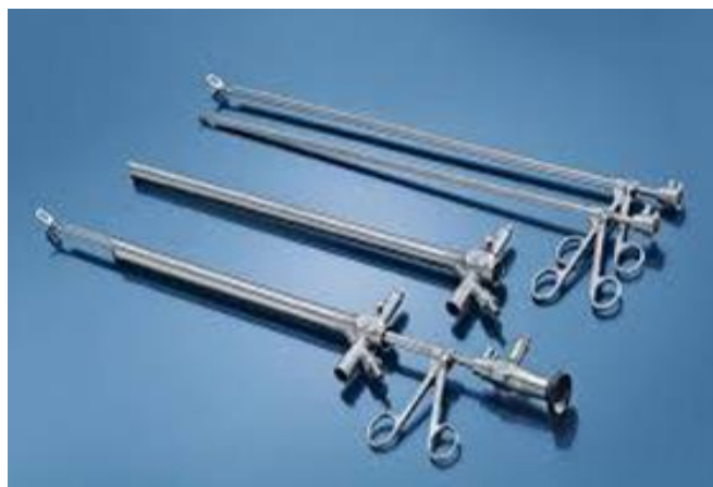
Slika 6.2.1. Instrumenti za rigidnu bronhoskopiju

Danas rigidnu bronhoskopiju izvodimo uglavnom u općoj anesteziji. Rigidni bronhoskop je ravna cijev izrađena od nehrđajućeg čelika, ima ih različitih dužina i promjera. Rigidni bronhoskop služi nam pri primjeni raznih terapijskih metoda kao što su krioterapija, balon dilatacija i implantacija stenta. Proksimalni dio služi za uvođenje raznih instrumenata, ventilaciju pluća i priključak na radno svjetlo, sastoji se od središnjeg i nekoliko postraničnih manjih otvora. Bronhoskopi za odrasle dužine su oko 40 cm, a promjer se kreće 9-14 mm. Dugo godina rigidna bronhoskopija se smatrala vrlo grubom metodom za bolesnika, no danas se smatra sigurnom i podnošljivom pretragom zahvaljujući poboljšanju opće anestezije i ventilacijskih tehnika u tijeku pretrage. Indikacije za rigidnu bronhoskopiju su terapijske i dijagnostičke. Terapijske indikacije su uklanjanje stranih tijela s prijetecom asfiksijom, postavljanje stenta, resekcija endobronhalnog tumora, masivna hemoptoa, rekanalizacija tumora, dilatacija stenozе. Dijagnostičke pretrage su transbronhalna i transtrahealna punkcija, biopsija tumora.