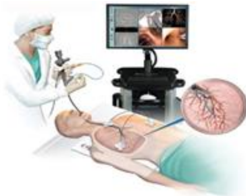
Slika 5.2. Bronhoskopija

Bronhoskopija je endoskopska metoda kojom se omogućuje pregled traheje i bronhalnog stabla do razine subsegmentalnih ogranaka. Primjenjuje se u svakodnevnoj pulmološkoj praksi, a i u drugim medicinskim disciplinama.