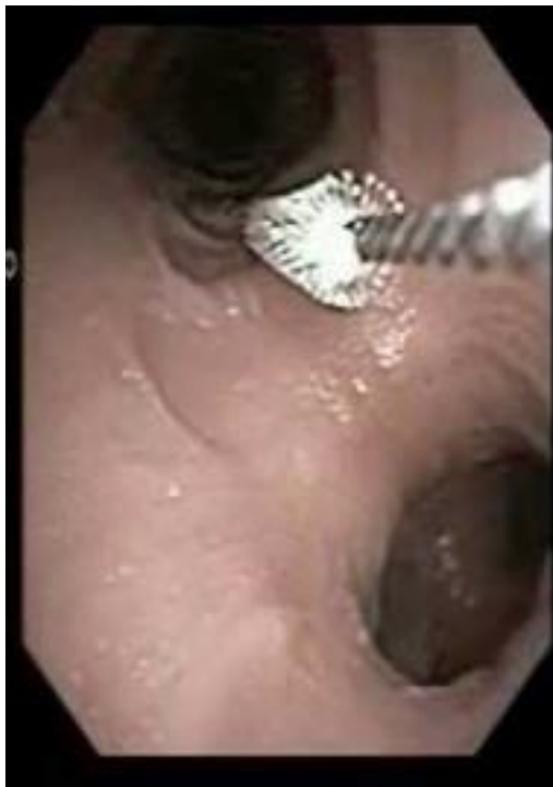
Slika 5.7.1. Obrisak četkicom (vlastiti izvor)

4. TRANSBRONHALNA BIOPSIJA-TBBP, to je postupak kojom se bioptička kliješta uvode do distalnih dijelova bronha ili do perifernih infiltrata. Tehnika transbronhalne biopsije se može uskladiti s bolesnikovim disanjem, tako da se kliješta zatvore na završetku ekspirija. Materijal se može obraditi citološki histološki, mikrobiološki, imunocitokemijski, imunohistokemijski i elektronskom mikroskopijom. Bioptati dobiveni na ovakavnačin su maleni pa je patološka analiza zbog veličine uzorka delikatna i zahtjeva iskusnog patologa. Ako uzimamo veći broj biopsija veći je rizik komplikacija pneumotoraksa i krvarenja. Komplikacije koje se mogu javiti su visoka temperatura koja je najčešće vezana uz pojavu krvarenja. Kod upotrebe većih kliješta češća komplikacija krvarenje, a kod upotrebe manjih kliješta pneumotoraks. Pnemotoraks se može pojaviti do 24 sata nakon biopsije i zato je najbolje bolesnika hospitalizirati. Kontraindikacija za transbronhalnu biopsiju