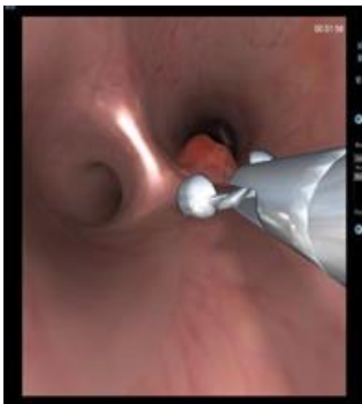
Slika 5.7.2. Biopsija tumora

pluća su sve bolesti i stanja u kojima bi razvoj komplikacija mogao biti fatalan. Zbog mogućih komplikacija ta se pretraga najčešće ne radi u ambulantnim uvjetima. Transbronhalna biopsija pluća korisna je metoda i u dijagnostici perifernog i metastaziranog karcinoma.