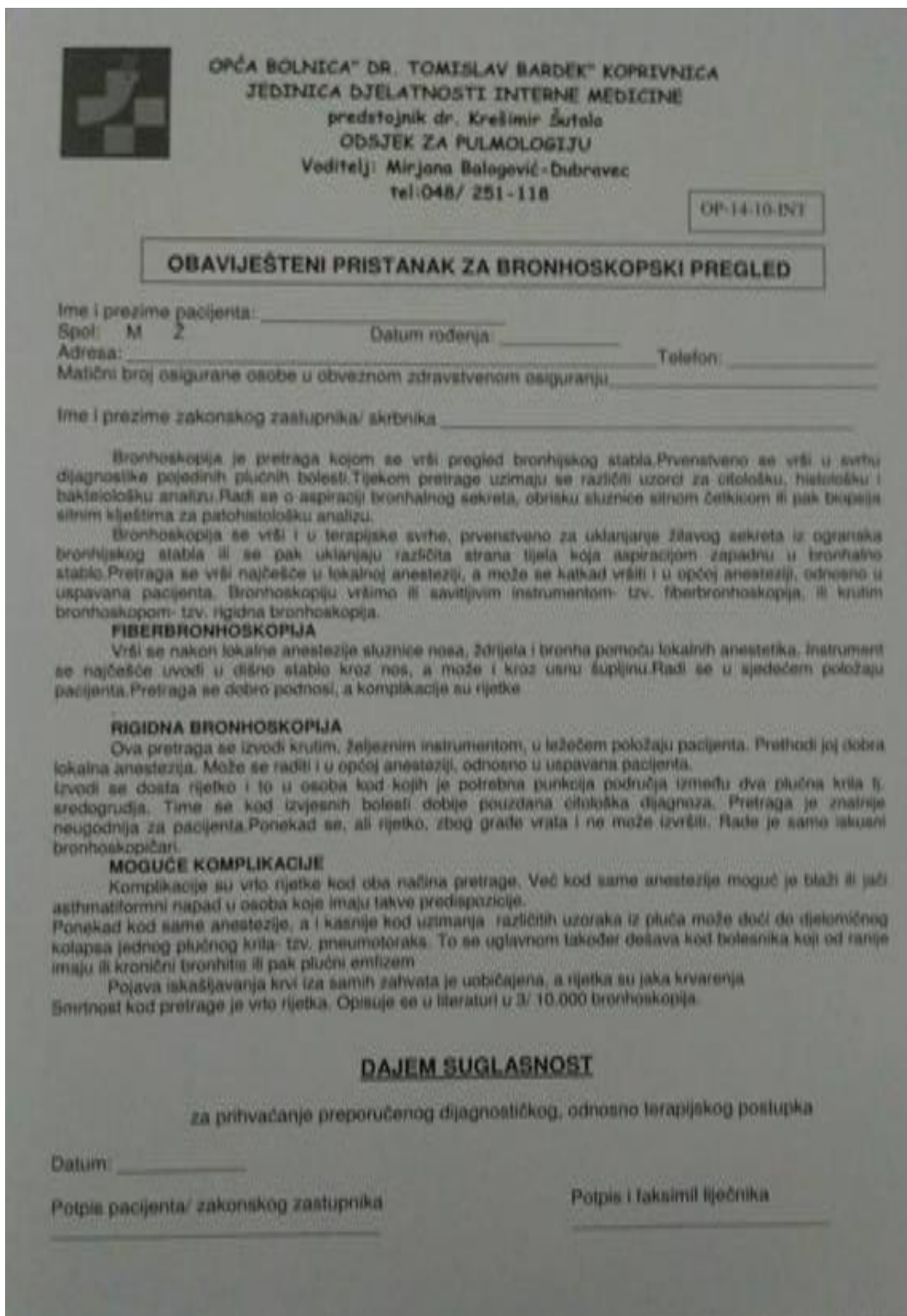
Slika 5.2. Obrazac obaviještenog pristanka za bronhoskopiju

Prije bronhoskopije bolesnici dobiju pismene i usmene upute o postupku nakon kojih moraju potpisati suglasnost za pristanak