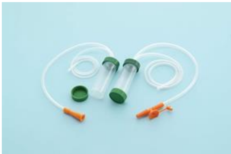
Slika 5.7. Dvostruki aspiracijski kateter za sterilno uzimanje uzoraka

Ovaj postupak važan je za dobivanje materijala iz alveola s redukcijom bilo kakve kontaminacije iz ostalih mjesta kao što su dišni putovi. Nakon dobivenog materijala lavat se dijeli u tri posudice za uzorke i što prije nosi na citološku, mikrobiološku i biokemijsku obradu. BAL se pokazao odličnom metodom u dijagnostici infekcija parenhima, može se postaviti dijagnoza malignih bolesti plućnog parenhima. Komplikacije su neznatne, a mortalitet nije zapažen. Može se javiti povišena tjelesna temperatura, bronhospazam.