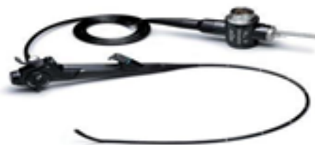
Slika 3. Bronhoskop

U Hrvatskoj su istaknuta dva imena na području bronhoskopije. Ivo Drinković je 1948., izveo prvu rigidnu bronhoskopiju, a Danijel Grozdek 1972.g. prvu fiberbronhoskopiju u bolnici Klenovnik. Danas se FOB primjenjuje u drugim medicinskim disciplinama te se njome koriste liječnici, intenzivisti, anesteziolozi, torakalni kirurzi, otorinolaringolozi i pedijatri. Razvitkom tehnologije javlja se i videobronhoskop s boljom rezolucijom bronhoskopske slike uz mogućnost edukacije i dokumentacije endoskopskog nalaza.