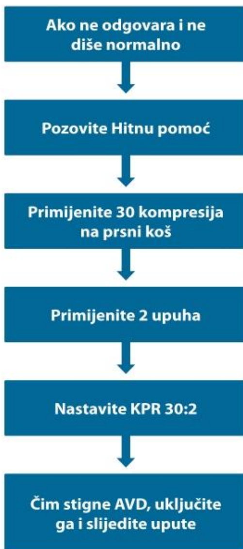
Slika 2. Postupnik za osnovno održavanje života uz uporabu automatskoga vanjskog defibrilatora.