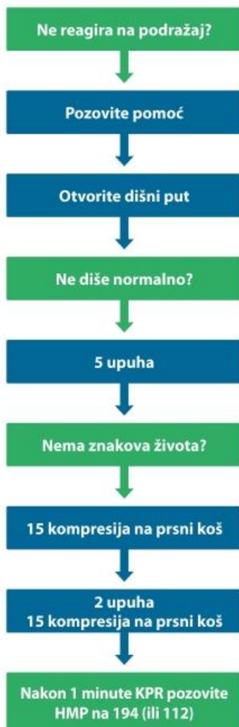
Slika 4. Postupnik za osnovno održavanje života djece.