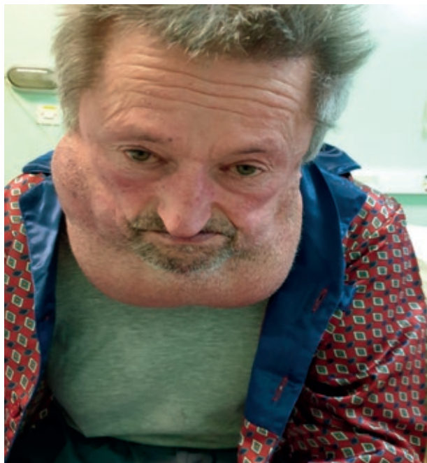
Sl. 1. Prijeoperacijski izgled bolesnika s Madelungovom bolesti.