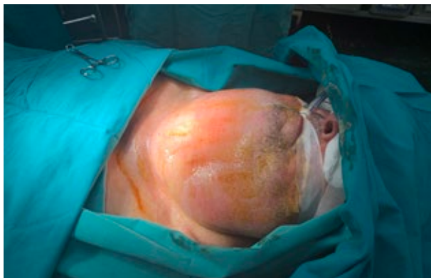
Sl. 3. „Ispunjen“ vrat od brade do ispod prsne kosti. Na koži je označena linija reza.