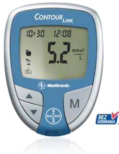
Slika 2. Glukometar(24)