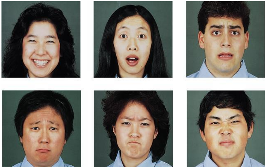
Slika 4.2.1. Neverbalna komunikacija

namršteno čelo ili stisnute usne mogu signalizirati neslaganje, zabrinutost ili ljutnju. Iako postoje univerzalni facijalni izrazi koji se mogu prepoznati u svim kulturama, interpretacija nijansi tih izraza može varirati ovisno o kulturološkim normama i kontekstima u kojima se koriste (Slika 2.) (16). Zbog toga je važno biti svjestan kulturnih razlika i prilagoditi interpretaciju facijalnih izraza specifičnostima pojedinca i situacije.