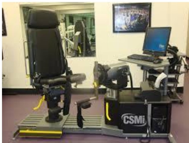
Slika 2. Aparat za izokinetičku dijagnostiku i terapije

Na izokinetičkom aparatu provodimo izokinetičku dijagnostiku i rehabilitaciju. Izokinetička dijagnostika nam omogućuje da se odredi rad, snaga i opseg pokreta za svaku pojedinu skupinu mišića (6). Nakon računalne obrade podataka i dobivenih rezultata za svakog ispitanika dobivamo njegove relativne vrijednosti. Tada radimo usporedbu sa standardnim vrijednostima uzevši u obzir spol, dob, tjelesnu težinu i visinu. Na temelju dobivenih rezultata izokinetičkom dijagnostikom započinje se individualnim vježbama. Izokinetičko testiranje traje oko 90 min, a vježbanje na izokinetičkom dinamometru traje oko 30-40 minuta (6).