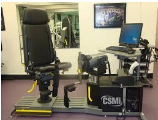
Slika 2. Aparat za izokinetičku dijagnostiku i terapije