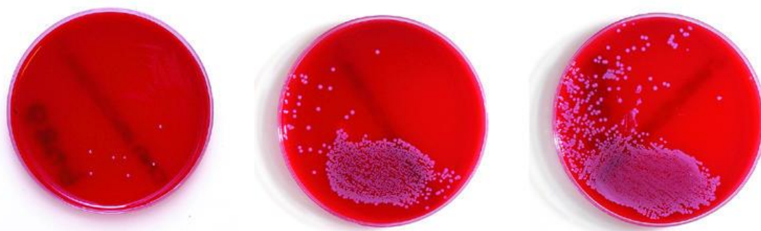
Slika 4.2. Prikaz slabog, umjerenog i jakog rasta bakterijske kulture na primjeru bakterije Staphylococcus aureus (4)