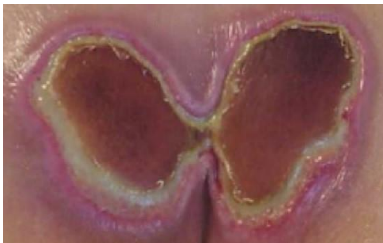
Slika 7.2. Kennedyjev terminalni ulkus leptirastog oblika (34)

Kennedyjev terminalni ulkus opisuje se kao leptirasti (Sl. 7.2.), kruškasti, potkovičasti i ponekad crveni/žuti/crni ulkus nepravilnog oblika, izgledom sličan ogrebotini ili mjehuru. Počinje iznenada kao mjehurić koji može biti vrlo krhak i čak i nježno čišćenje može promijeniti površinu kože od netaknute do prilično velike otvorene rane. Može brzo napredovati do drugog, trećeg ili četvrtog stupnja. Ponekad je okolno tkivo mekano ili opušteno ispod površine. Vrijeme je ključni faktor. Terminalni ulkusi nastaju brzo i brzo napreduju, često unutar nekoliko sati. Poznato je da se također mogu pojavljivati i na petama, stražnjim mišićima potkoljenice, rukama i laktovima (33).