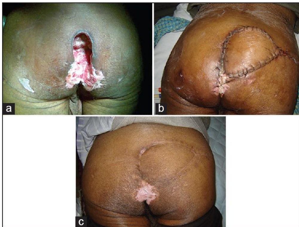
Slika 9.1. Sakralni dekubitus četvrtog stupnja nakon rekonstruktivne kirurgije regionalnim zaliskom. (54)