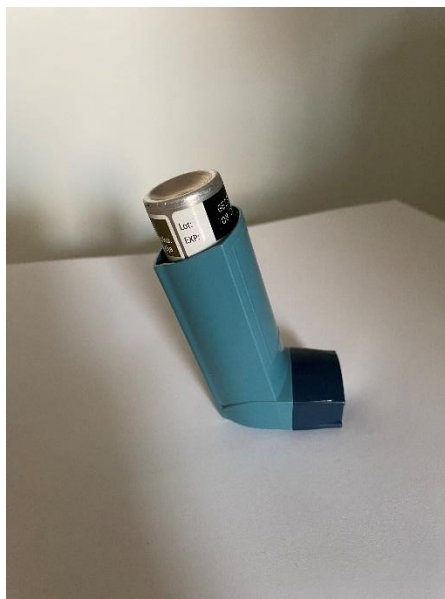
Slika 6.1. Sprej ili pumpica

Kako bi se omogućila što veća učinkovitost lijeka primjenjuje se inhalacijska terapija koja lijek dovodi direktno u pluća, a najčešći inhalatori koji se koriste su: sprej ili pumpica (Slika 6.1.), diskus (Slika 6.2.) , turbuhaler (Slika 6.3.) te novolizer (Slika 6.4.).