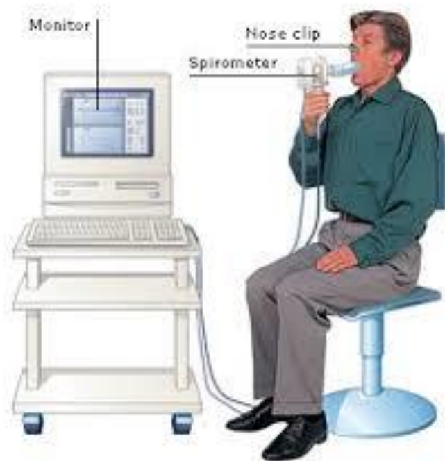
Slika 5.1 Izvođenje spirometrijskog testa (16).

testa mora jako udahnuti zrak te ga nakratko zadržati, svojim usnicama treba zahvatiti jednokratni usnik i ispuhati cijeli zrak iz pluća, zrak ne smije izlaziti i zbog toga se stavlja štikaljka na nos. Preporučljivo je da izdah traje oko šest sekundi i važno je da bolesnika potičemo na izdisaj do samog kraja. Test je najbolje izvesti do tri puta ukoliko se mjerenja ne razlikuju više od 100 ml (16).