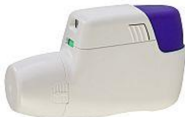
Slika 6.4. Novolizer (36)