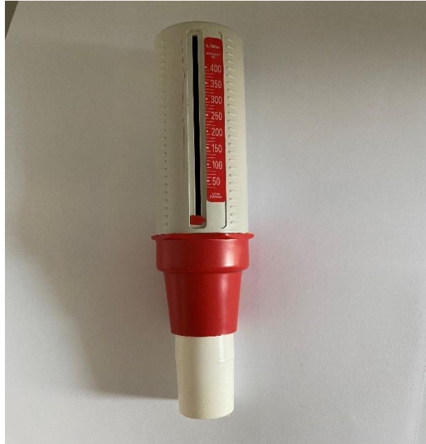
Slika 5.2 Mjerač vršnog protoka zraka