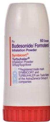
Slika 6.3. Turbuhaler (36)

Svaki aplikator je drugačiji pa je važno znati primjenu za određeni aplikator, kod pumpice spremnik je pod pritisak, a unutar spremnika je lijek skupa s potisnim plinom. Turbuhaler i diskus nemaju plin te oni nisu pod pritiskom. Kako su aplikatori drugačiji, bitna je i pravilna primjena lijeka kako bi se postiglo poboljšanje liječenja.