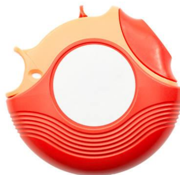
Slika 6.2. Diskus (36)