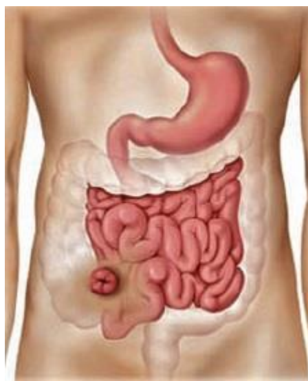
Slika 4.3. Formirana ileostoma (4)

Krug ili elipsa kože od 2,5 do 3 cm izrezuje se monopolarnom dijatermijom (kože se može podići prema gore pomoću Alice ili Littlewood stezaljke) (4). Tkivo se zatim secira kroz potkožno masno tkivo do prednje fascijalne ovojnice rectus musculusa, koja se zatim otvara kroz križni rez. Rectus musculus je raširen ili uvučen medijalno, no pozornost se mora obratiti na krvne žile koje se protežu duboko u središtu ovog mišića. Nakon što se uvuče, ispod mišića se vidi stražnja ovojnica koja je obično zatvorena i pričvršćena za peritoneum na donjoj površini. Još jedan križni rez se napravi na stražnjoj ovojnici, a zatim se dvije Kellyjeve kopče koriste za hvatanje peritoneuma i njegovo podizanje. Škarama za disekciju napravi se rez u peritoneumu između dvije kopče što omogućuje pristup u peritonealnu šupljinu. Kirurški rez se rasteže do širine dva prsta, što osigurava dovoljno prostora za tanko crijevo i formiranje ileostome. Sljedeći korak u formiranju ileostome je nježno provlačenje odabranog segmenta terminalnog ileuma kroz prethodno formiran prolaz (Slika 4.3.) (4,8).