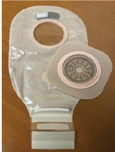
Slika 4.4. Dvodijelni stoma sustav (4)