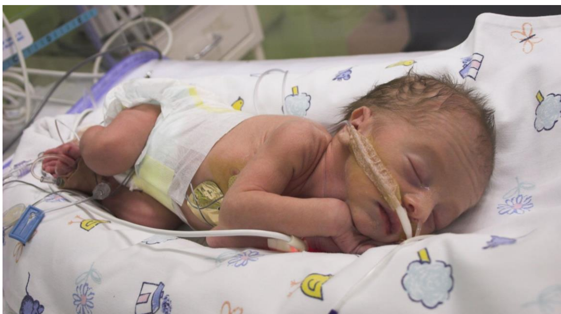
Slika 7.1. Nedonošče

Kosti prsa su izrazito mekane te zbog nerazvijenog masnog tkiva lako se uočava vrh ksifoidne kosti (1). Na prsima se bradavice razvijaju oko 26. tjedna i slabo su uočljive (2). Tempo napredovanja u rastu i pojavi novorođenačkih refleksa je kod svakog djeteta drugačiji, stoga postoji širok raspon granica normale.