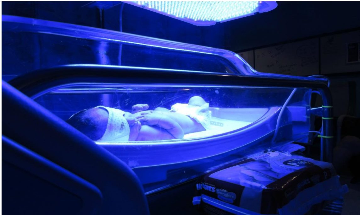
Slika 8.1. Fototerapija

Nedonošćad rođena s prirođenim nedostatkom enzima posebno je sklona štetnim učincima nekonjugiranog bilirubina na središnji živčani sustav. U slučaju da se ne liječi na odgovarajući način može dovesti do akutne i kronične bilirubin encefalopatije (1). Najčešće se za liječenje koristi fototerapija, transfuzija krvi i primjena intravenskih imunoglobulina. Fototerapija predstavlja prvu liniju liječenja patološke nekonjugirane hiperbilirubinemije. Učinkovitost fototerapije ovisi o dozi i valnoj duljini korištene svjetlosti te o površini tijela djeteta koje mu je izloženo. Tijekom fototerapije oči novorođenčeta moraju biti pokrivena kako bi se izbjegla ozljeda mrežnice. Nuspojave s primjenom fototerapije uključuju osip, dehidraciju, hipokalcemiju, oštećenje mrežnice, hemolizu i alergijske reakcije (1).