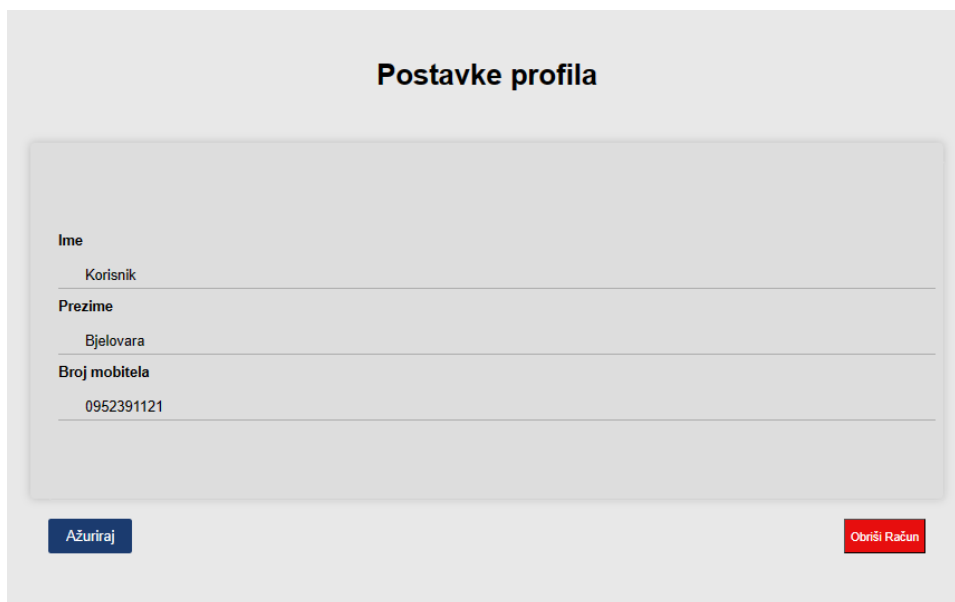
Slika 3.4: Komponenta Account i automatska popuna informacija

princip za lakše ažuriranje informacija primijenjen je bilo gdje gdje je informacije moguće ažurirati, krajnji rezultat vidljiv je sa slike 3.4.