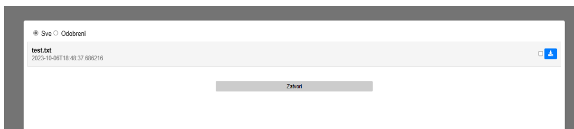
Slika 3.5: UserFileModal komponenta za provjeru i pregled datoteka

Prilikom prijave voditelja ustanove, pojavljuje se sadržaj komponente SchoolAdmin koja zove komponentu UserList s parametrima koji govore da treba prikazati samo one korisnike koji pripadaju ustanovi voditelja. U listi nalaze se opcije za deaktivaciju korisnika i modal UserFileModal. UserFileModal voditelju daje uvid u sve datoteke odabranog korisnika te pregled statusa datoteke zajedno s opcijom za preuzimanje. Voditelj može datoteku odobriti ili ostaviti na čekanju. Dodatno u listi s korisnicima nalaze se filteri za pretraživanje te pregled svih korisnika, voditelja ili nastavnika sa statusima aktivni ili neaktivni. Izgled modala za upravljanje provjerom i potvrdom datoteka vidljiv je na slici 3.5.