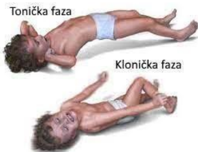
Slika 3.1. Prikaz toničke i kloničke faze (6)