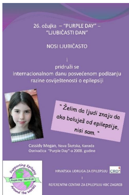
Slika 8.1. Plakat za Ljubičasti dan (14)

Od epilepsije su bolovale mnoge poznate osobe u povijesti, a ima ih i u ovo naše vrijeme. Povijesne ličnosti koje su bolovale od epilepsije su: Sokrat (filozof), Aleksandar Veliki (makedonski kralj), Gaj Julije Cezar (rimski diktator), Blaise Pascal (filozof i matematičar), Napoleon Bonaparte (Francuski car), Fjod Mihajlovič Dostojevski (književnik), Alfred Nobel (kemičar i izumitelj), Vincent van Gogh (slikar), Michelangelo Buonarroti (slikar), Edgar Allan Poe (pisac), Petar Iljič Čajkovski (skladatelj) i Agatha Christie (spisateljica kriminalističkih romana). Unatoč epilepsiji bili su uspješni i poznati u svijetu. Njihova djela i postignuća dokaz su da epilepsija nije psihička bolest te da epilepsija ne onemogućuje osobu za daljnje samostalno življenje, rad i izvršavanje svakodnevnih aktivnosti, izgradnju karijere, bavljenje hobijima, ne utječe na kreativnost, uspjeh i slično.