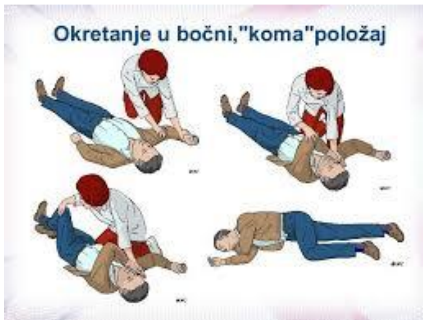
Slika 7.2. Bočni položaj – postupak nakon epileptičnog napadaja (13)

Nakon napadaja važno je odmah postaviti bolesnika u bočni položaj, što je prikazano na Slici 7.2. te mu omogućiti da spava. Kad se probudi, medicinska sestra mora orijentirati bolesnika i sve evidentirati u svoju dokumentaciju (4).