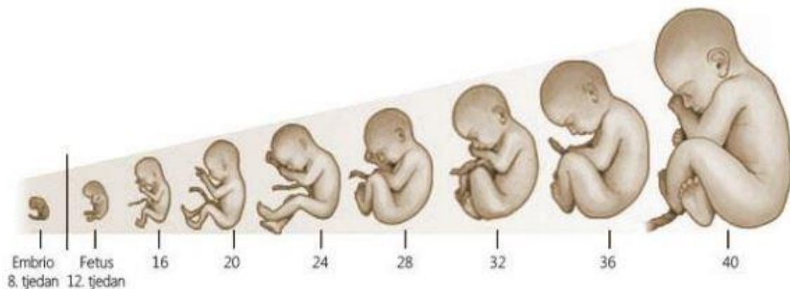
Slika 1.1. Razvoj humanog embrija (6)

Trudnoća ili graviditet nastaje nakon što oplodjena jajna stanica se usadi u endometrij maternice. Sama oplodnja nastaje kada se zrela jajna stanica i spermatozoid spoje, zatim oplodjena jajna stanica zbog peristaltičkih pokreta jajovoda i kretanjem trepetiljki epitela jajovoda dopijeva u šupljinu maternice gdje dolazi do nidacije, tj. implantacije oplodjene jajne stanice. Implantirana jajna stanica se naziva zametak ili embrij. Nakon završene organogeneze, odnosno poslije trećeg mjeseca trudnoće zametak postaje plod ili fetus (5). Razvoj fetusa kroz tjedne prikazan je na slici 1.1.