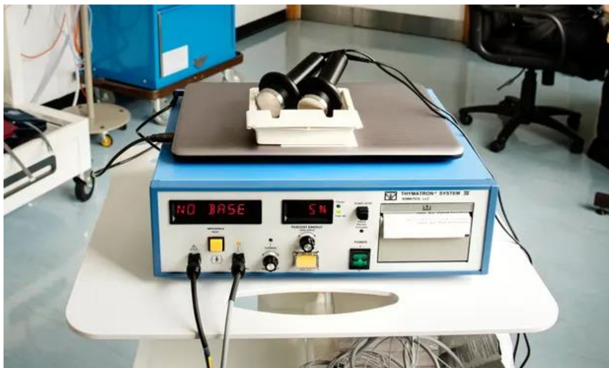
Slika 2. Uređaj za provođenje elektrokonvulzivne terapije (25).