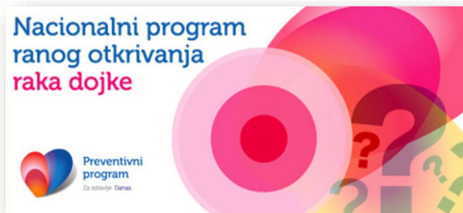
Slika 5.2.2.2. Logo Nacionalnog programa ranog otkrivanja raka dojke