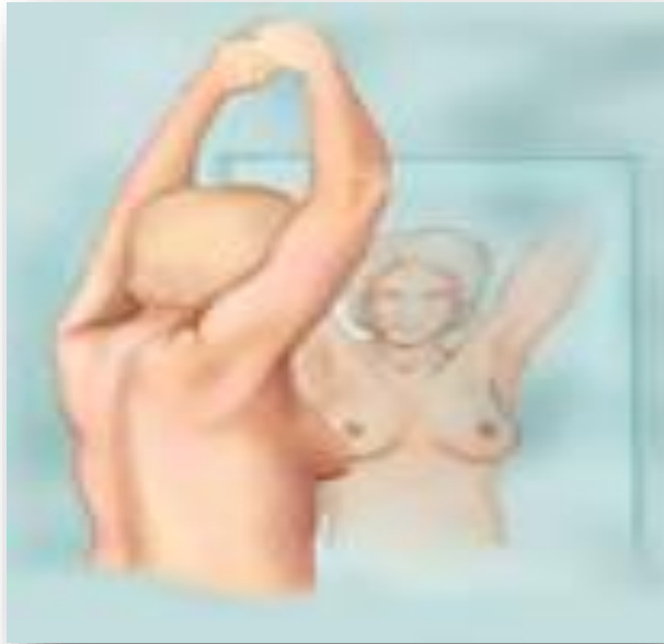
Slika 5.2.1.2. Inspekcija s podignutim rukama