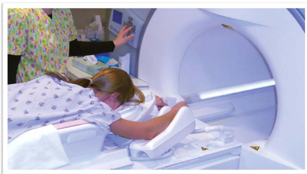
Slika 5.2.1.6. Magnetska rezonancija dojke