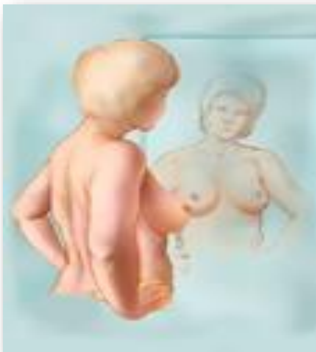
Slika 5.2.1.1. Inspekcija rukama oko bokova