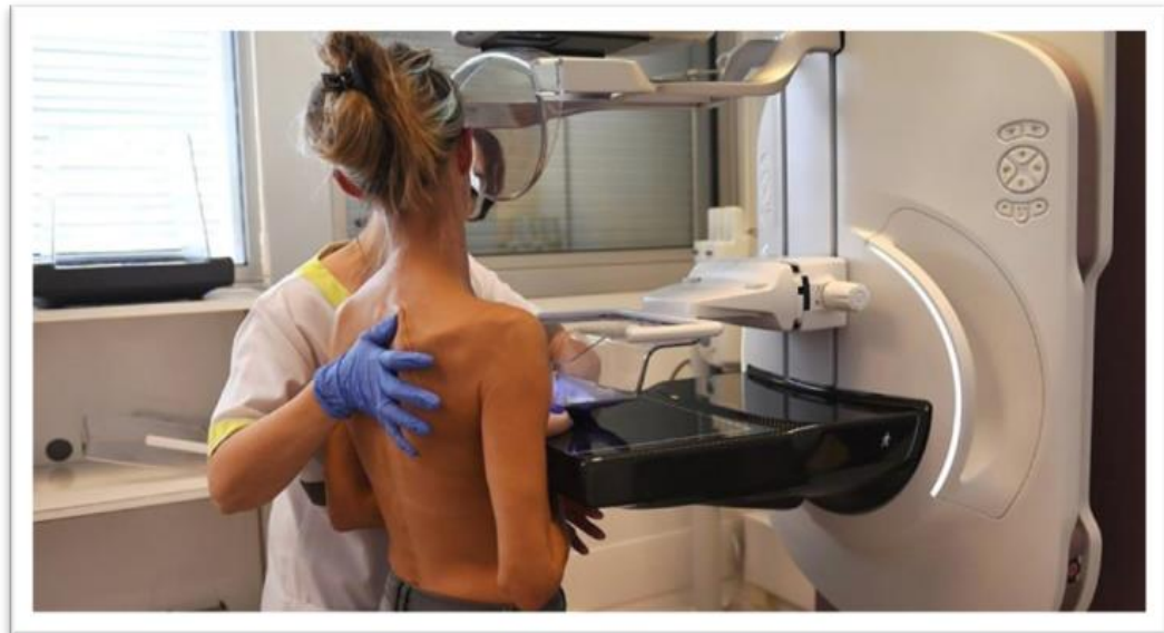
Slika 5.2.1.4. Mamografski pregled

Mamografija je jedna od najvažnijih metoda oslikavanja u dijagnostici bolesti dojki. Mamografija ima prihvatljivu specifičnost i visoku senzitivnost za rano otkrivanje raka dojke. Slika 5.2.1.4 prikazuje mamografski pregled.