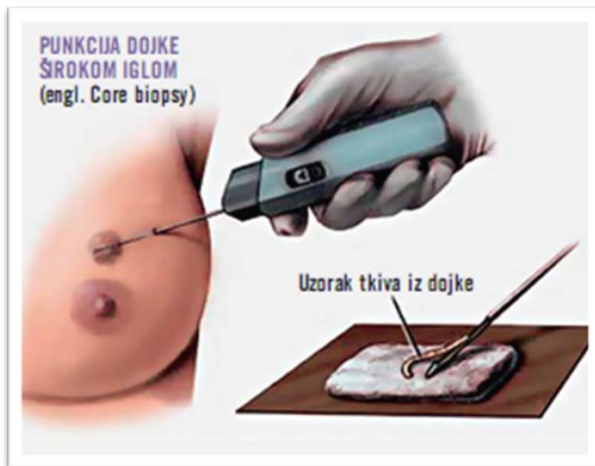
Slika 5.2.1.7. Punkcija dojke širokom iglom

Prednost citološke punkcije je gotovo atraumatska procedura, a vrlo rijetko nastaje hematoma nakon citološke punkcije te nema dokaza da dolazi do raspona tumora u punkcijskom kanalu. Glavni nedostatak citološke punkcije je u velikoj ovisnosti o individualnom iskustvu, tj. kompetenciji liječnika koji radi punkciju. Biopsija ima manju ovisnost o iskustvu osobe koja je izvodi, a određeni patolozi lakše tumače bioptičke uzorke nego citološke razmaze. Iz bioptičkog uzorka iskusan patolog može dobiti više informacija nego iz citološkog razmaza. Biopsija uključuje inciziju kože, lokalnu anesteziju te traje dulje nego citološka punkcija. Slika 5.2.1.7. prikazuje punkciju dojke širokom iglom.