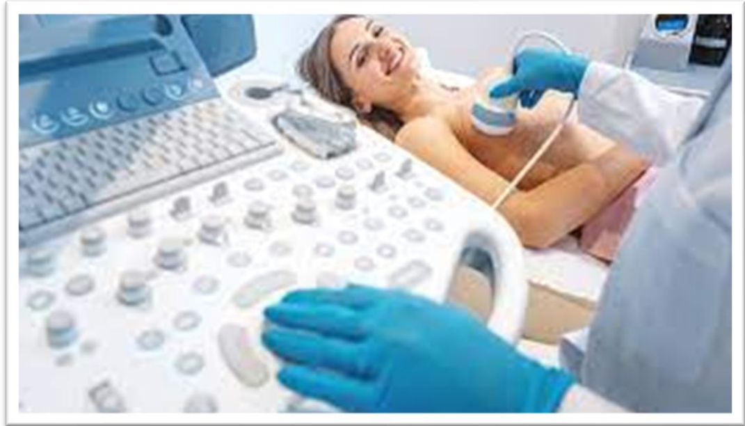
Slika 5.2.1.5. Ultrazvuk dojki

UZV i mamografski nalaz te dijagnozu potvrditi ciljanom punkcijom ili biopsijom vidljivih lezija pod kontrolom UZV-a (7). Slika 5.2.1.5 prikazuje ultrazvuk dojke.