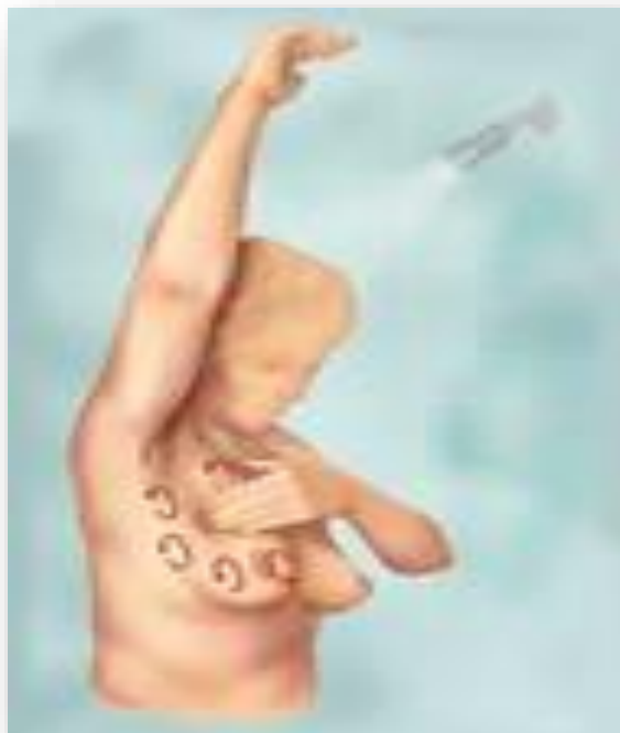
Slika 5.2.1.3. Palpacija dojke u stojećem stavu