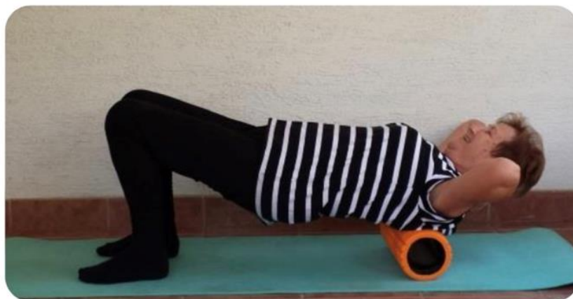
Slika 23 relaksacija leđnih mišića