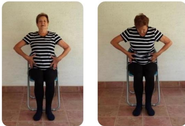
Slika 4 udah i izdah uz kontrolu rebara