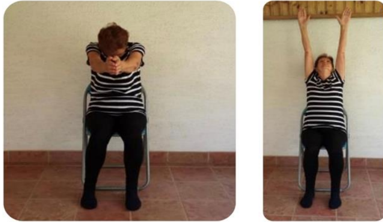
Slika 3 izdah iz uzručenja do predručenja