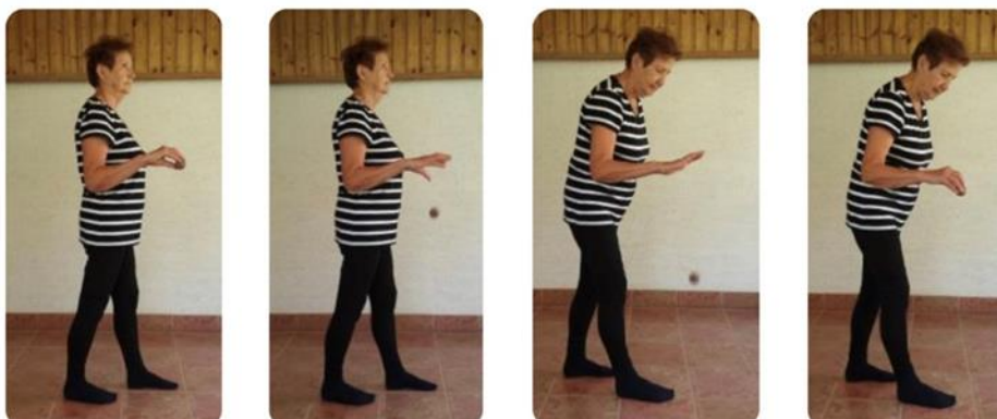
Slika 10 hodanje s odbijanjem loptice o pod