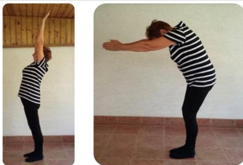
Slika 6 izdah iz uzručenja do predručenja