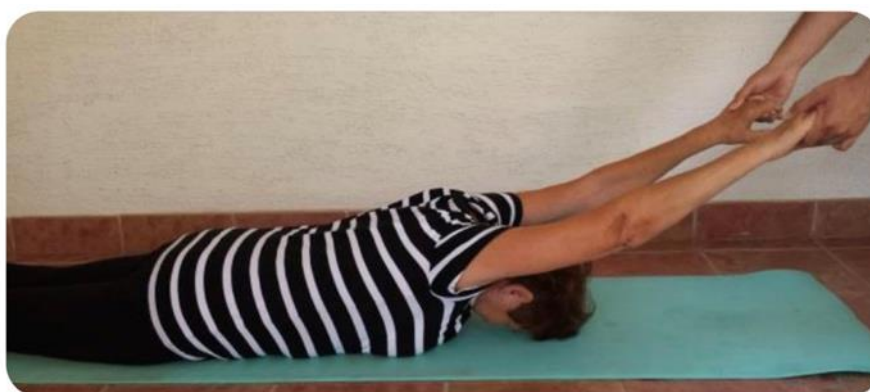
Slika 19 istezanje leđa i ramena