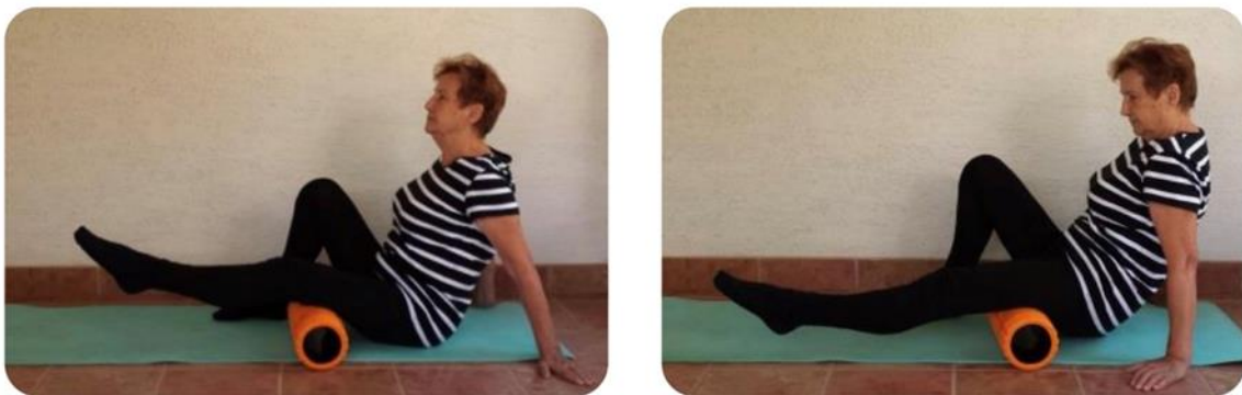
Slika 26 relaksacija mišića stražnjeg dijela natkoljenice