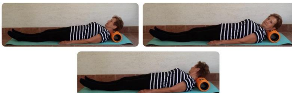
Slika 22 relaksacija vratnih mišića

Kod vježbi istezanja vrlo je bitno pravilno disanje, kao i tijekom provođenja vježbi relaksacije. One mišićne skupine koje su tijekom vježbanja najviše pod stresom se opuštaju (23). Opuštanje mišića moguće je uz pomoć spužvastih valjaka, a može se raditi i samostalno pod vodstvom terapeuta (18). Vježbe za opuštanje mišića vrata (Slika 22 Relaksacija vratnih mišića), leđa (Slika 23 Relaksacija leđnih mišića) i prednjih bedara (Slika 24 relaksacija kvadricepsa) izvode se u ležećem položaju, dok se mišići predjela kukova (Slika 25 Relaksacija gluteusa), stražnjih bedara (Slika 26 Relaksacija mišića stražnjeg dijela natkoljenice) i listova (Slika 27 Relaksacija tricepsa surae) izvode u sjedećem položaju.