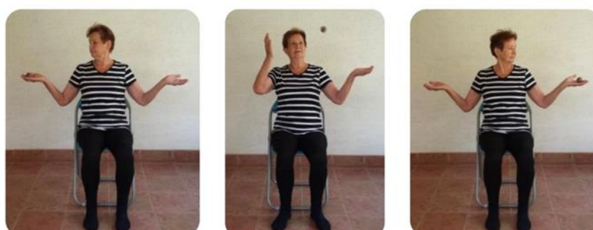
Slika 11 prebacivanje loptice iz ruke u ruku u sjedećem položaju