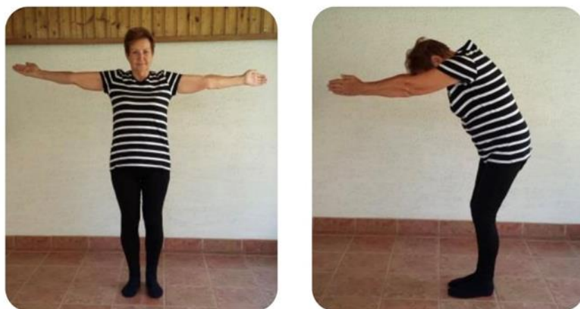
Slika 5 izdah iz odručenja do predručenja