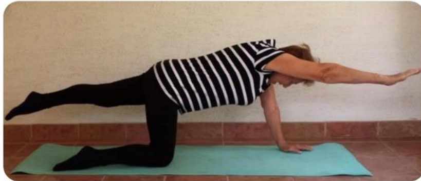
Slika 12 poza strijelca

ruku i ramenog pojasa doći će do smanjenja kontraktura (19). Slika 12 prikazuje pozu strijelca kojom se stabiliziraju mišići trupa. Na slikama 13, 15 i 16 prikazane su vježbe za jačanje mišića trupa i udova: slika 13 podizanje kukova u istovremenu adukciju, slika 15 opuštanje laktova u sjedećem položaju, a slika 16 prikazuje čučanj uz predručenje. Jačanje mišića ruku i ramena prikazano je na slici 14 adukcija u predručenju.