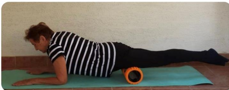
Slika 24 relaksacija kvadricepsa