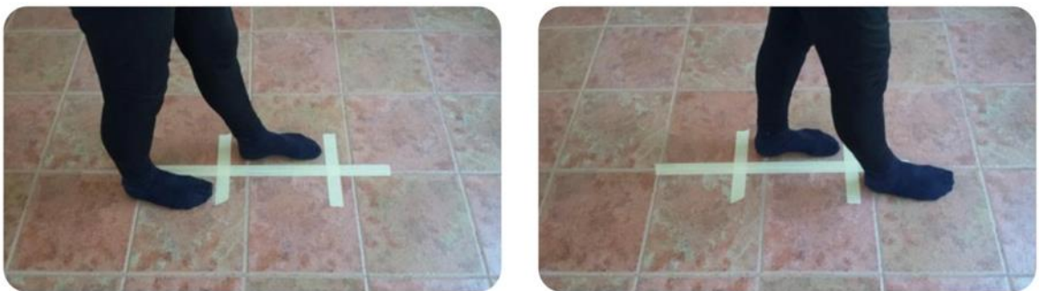
Slika 8 vježbanje pravilnog hoda