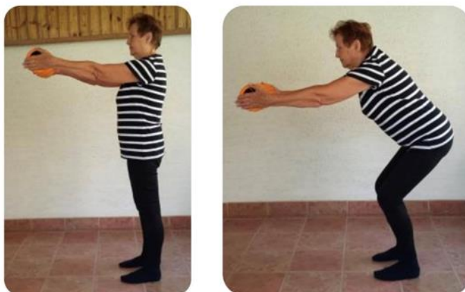
Slika 16 čučanj uz predručenje