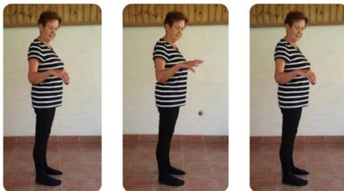
Slika 9 odbijanje loptice o pod u stajaćem položaju