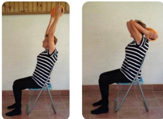
Slika 15 opružanje laktova u sjedećem položaju