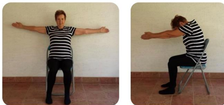
Slika 2 izdah iz odručenja do predručenja

Osim vježbi kojima se želi postići bolje fizičko kretanje pacijenta, u rehabilitaciju i fizikalnu terapiju ubrajamo i vježbe disanja, ravnoteže, istežanja, jačanja i opuštanja (18). Vježbe disanja osnažuju pokretljivost mišića za disanje, ali i rebara prsnog koša, dijafragme, srca te donjeg dijela trbuha. Mišić koji je aktivan tijekom inspiracije, a ujedno je i najvažniji, je dijafragma. Kod ubrzanja ventilacije i povećanja njezine dubljine, aktiviraju se i mišići koji sudjeluju u fazi ekspiracije (ekspiratorni mišići) tijekom koje potiskuju organe u truhu i vuku prema dolje 7 donjih rebara. Vježbe disanja se provode kako bi se smanjili razni kardiorespiratorni i postularni problemi. Kod izvođenja vježbi potrebno je udisaj usmjeriti prema prsnoj šupljini, a faza izdisaja treba biti dvostruko duža od faze udisaja. Prilikom disanja, ritam se smije mijenjati. Vježbe se mogu izvoditi u ležećem, sjedećem ili stajaćem položaju, ovisno u kojem se položaju pacijent najbolje osjeća (20). Izvođenje vježbi disanja u sjedećem položaju prikazano je na slikama 2., 3 i 4. Slika 2 prikazuje izvođenje pravilnog izdaha od odručenja do predručenja, slika 3 također prikazuje pravilan izdisaj ali iz uzručenja do predručenja, dok na slici 4 vidimo prikaz udaha i izdaha uz kontrolu rebara. Na slici 5 možemo vidjeti izdah iz odručenja do predručenja, a na slici 6 izdah iz uzručenja do predručenja.