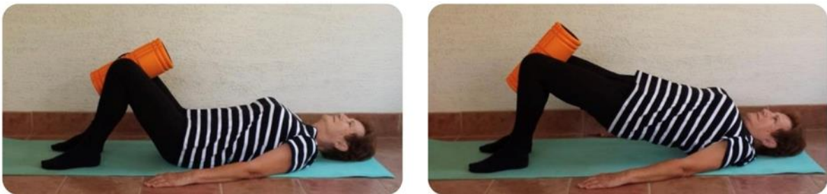
Slika 13 podizanje kukova u istovremenu adukciju