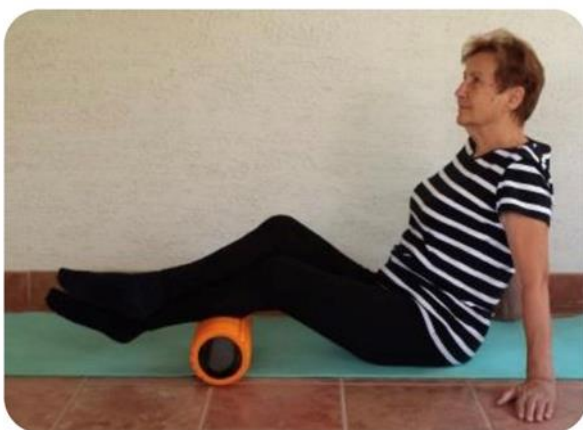
Slika 27 relaksacija tricepsa surae