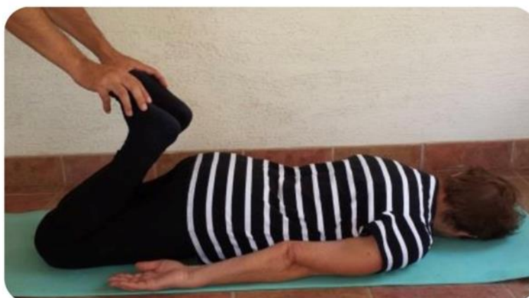
Slika 20 istezanje kvadricepsa