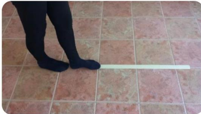
Slika 7 hod po ravnoj liniji

nezgrapnih koraka te nemogućnosti koordinacije ruku i nogu pri hodu. Program vježbi koordinacije obuhvaća vježbe za održavanje pravilnog hoda i vježbe za koordinaciju ruku i nogu (21). Na slikama 7 i 8 prikazane su vježbe za održavanje pravilnog hoda: slika 7 prikazuje hod po ravnoj liniji, a slika 8 vježbanje pravilnog hoda. Na slici 9 i 10 vidimo vježbe za koordinaciju ruku i nogu, dok se na slici 11 nalazi prikaz vježbe za koordinaciju ruku. Slika 9 prikazuje odbijanje loptice o pod u stajjećem položaju, slika 10 hodanje s odbijanjem loptice o pod, a slika 11 prebacivanje loptice iz ruke u ruku u sjedećem položaju.