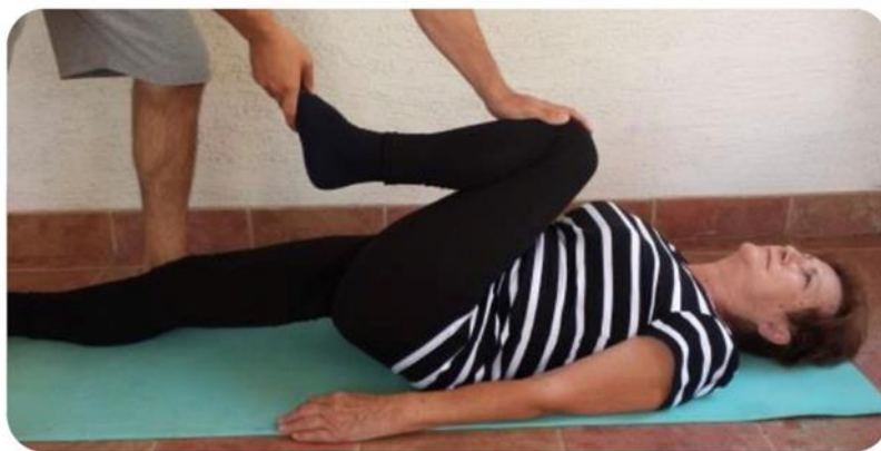
Slika 18 istezanje gluteusa