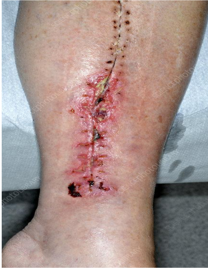
Slika 6.1. površinska incizijska infekcija