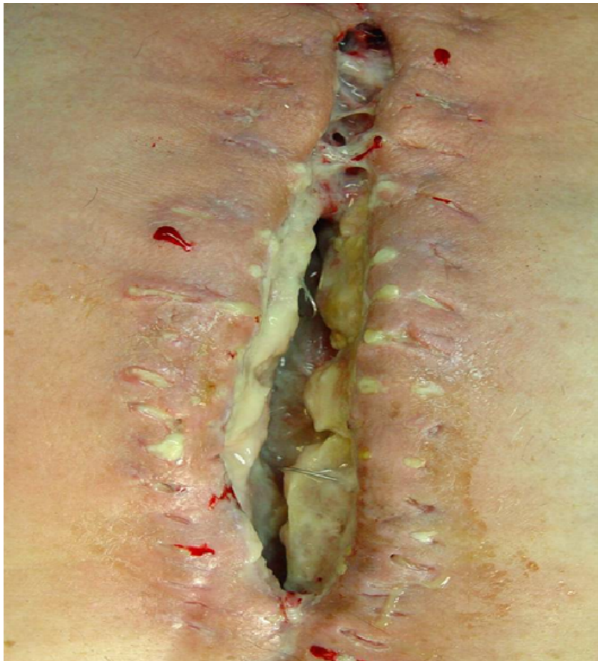
Slika 6.2. Duboka incizijska infekcija

Na slici 6.2. prikazana je duboka incizijska rana. Rana se nalazi na prsištu, a nastala je operacijom aortokoronarnog premoštenja. Ova rana prošla je kroz slojeve epidermisa, dermisa i supkutanog tkiva. Može se uočiti prisutnost gnojnog sekreta na dnu rane te na mjestima gdje su bili šavovi. Prisutno je blago crvenilo i edem rubova rane.