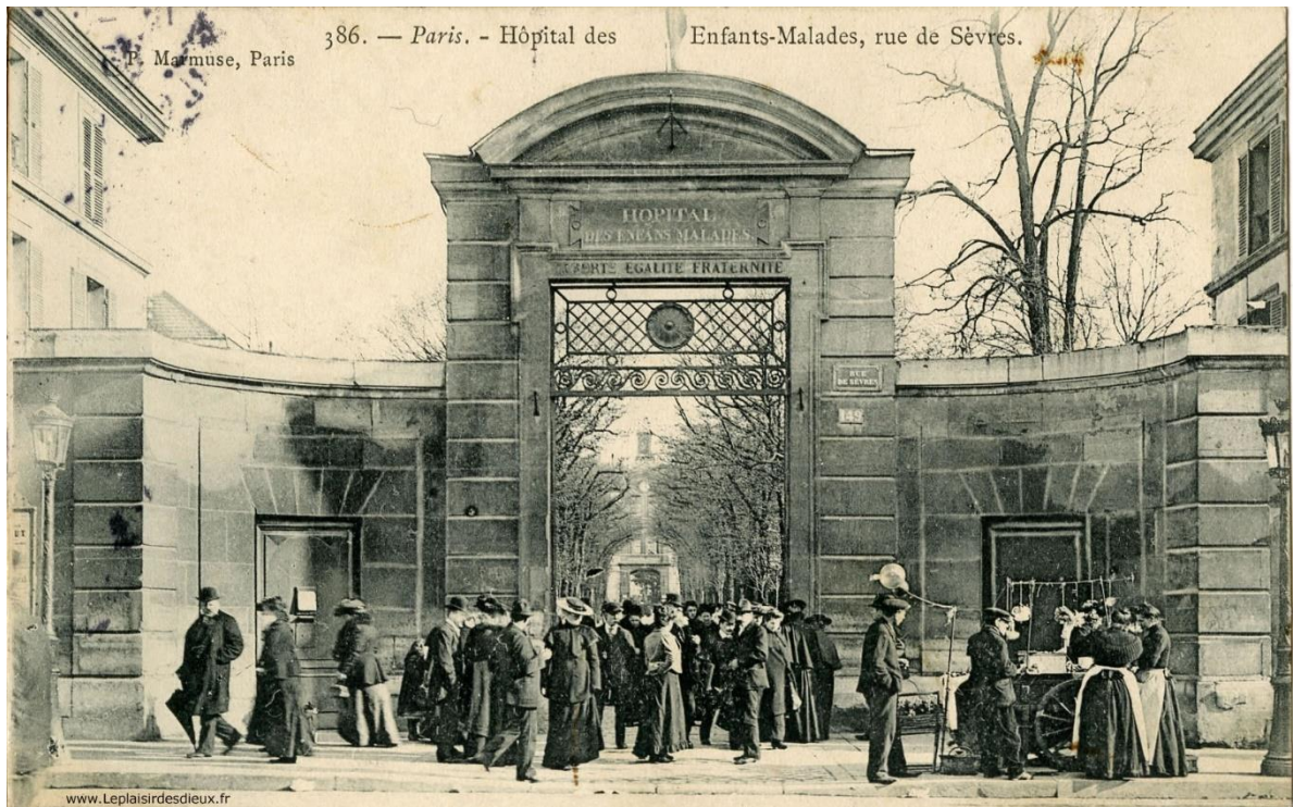
Slika 3. Prva dječja bolnica u svijetu, Pariz, 1802. godine.