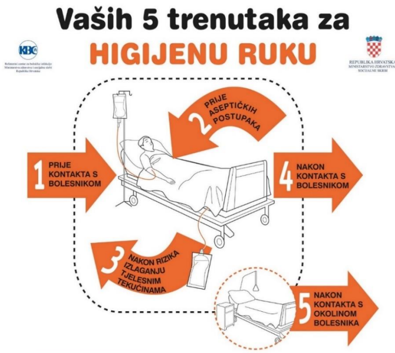
Slika 5.1.4. Pet trenutaka za higijenu ruku. (World Health Organisation, 2009.)