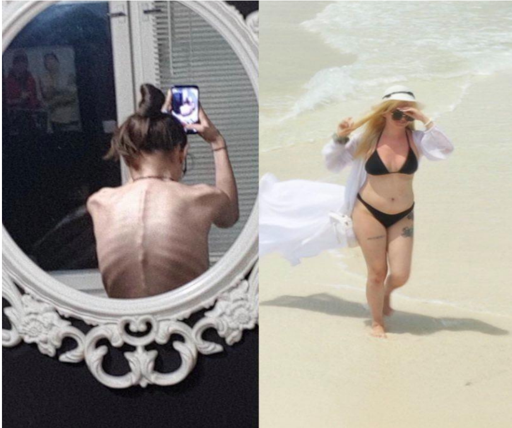
Slika 1. Prikaz fizičkog stanja za vrijeme liječenja i nakon operavka