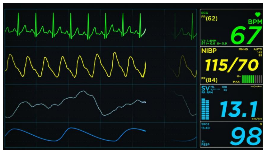
Slika 4.4. Prikaz EKG monitoringa

Medicinske sestre prate EKG (prikazan na slici 4.4. (16)) i primjećuju aritmije te započinju liječenje. Potrebno je da svaki član u radnom timu bude poučen o kardiopulmonalnoj reanimaciji. Bolesti koji uz infarkt miokarda prate bolesnika potrebno je primjereno liječiti (2).