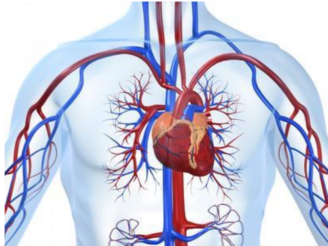
Slika 4.1. Položaj srca u prsnoj šupljini

Srce se nalazi u prsnoj šupljini i šuplji je mišićni organ. Vrh srca usmjeren je prema dolje, lijevo i naprijed, a srčana osnovica usmjerena je prema nazad i gore (8) što je prikazano na slici 4.1. (9).