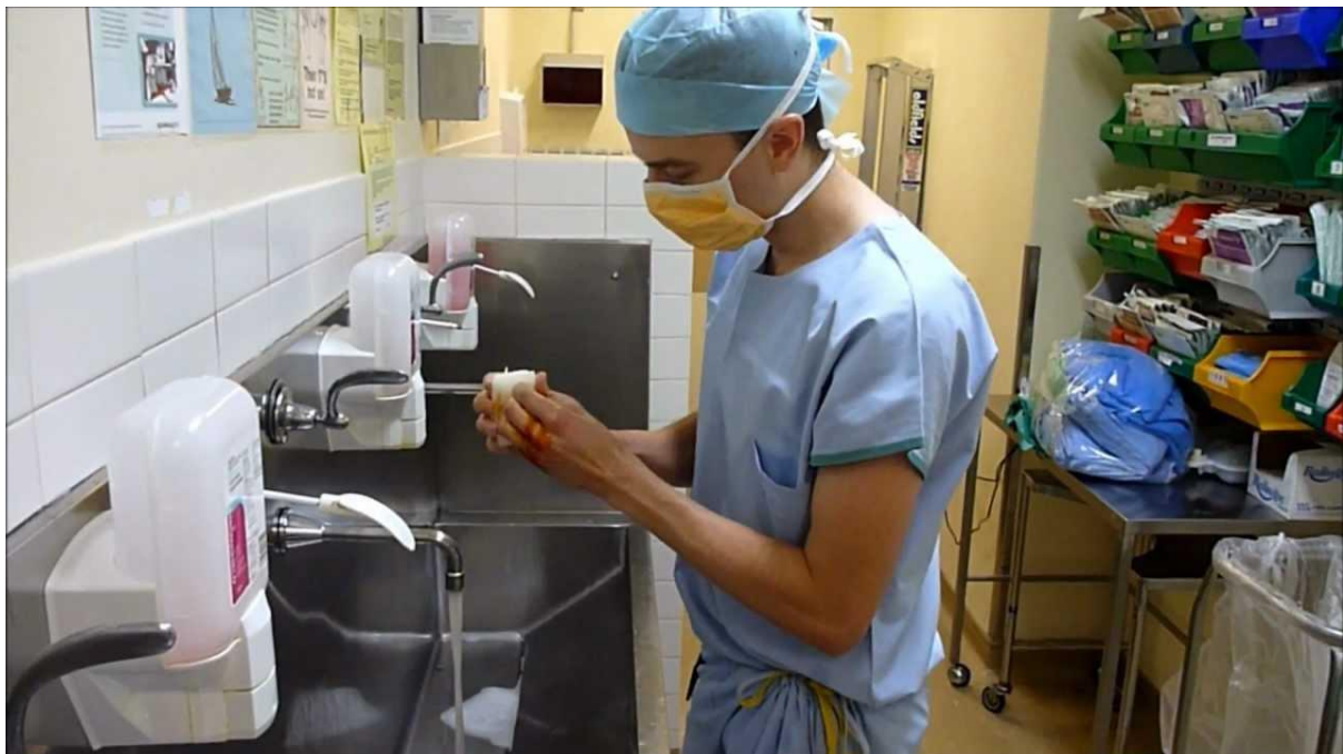
Slika 4.2. Prikaz prostorije za kirurško pranje ruku.

Iako se radi o odvojenom prostoru, prostorija za kirurško pranje ruku je u neposrednoj blizini operacijske sale jer se na taj način lakše osiguravaju aseptični uvjeti rada. Vrata koja odvajaju prostoriju za kirurško pranje ruku od operacijske dvorane otvaraju se sama kako bi se izbjegao kontakt sterilnog kirurškog tima s vratima nakon što je proveden proces kirurškog pranja ruku (Slika 4.2). Prostorija je opremljena s nekoliko kada i slavina te posudama sa sterilnim četkama i posudama s dezinficijensom [1].