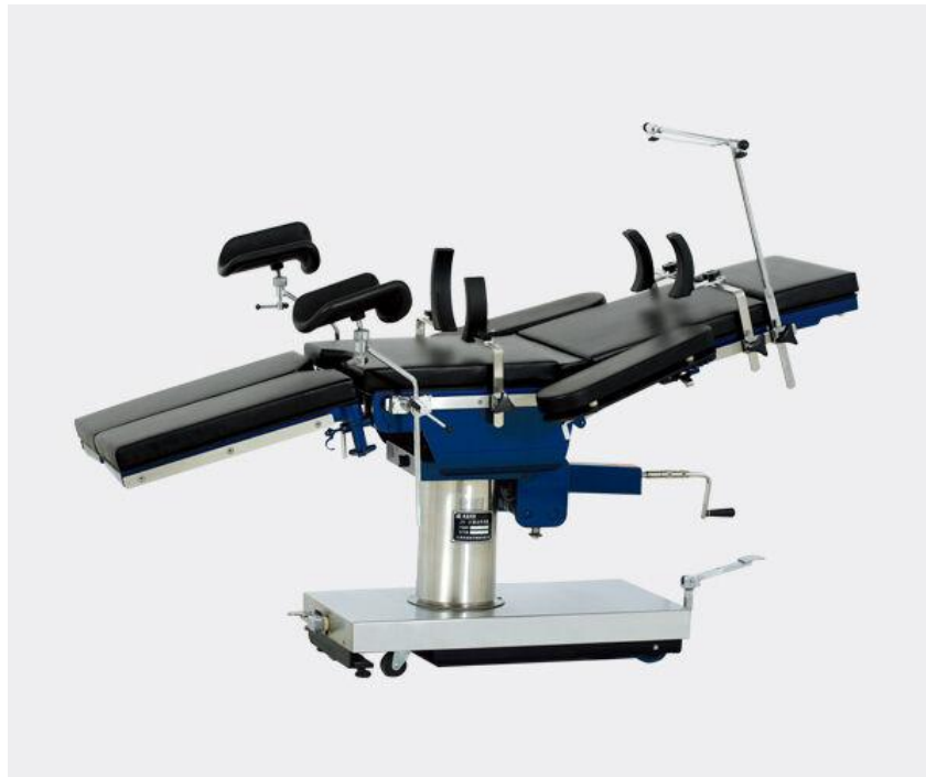
Slika 4.4. Prikaz multifunkcionalnog operacijskog stola

Stol je prilagodljiv jer ima funkcije podizanja, spuštanja ili rotiranja pojedinih dijelova u lijevu ili desnu stranu. Antistatični jastuci izrađeni od dva sloja koja su popunjena spužvom uz udobnost i zaštitu tkiva od utjecaja tlaka tijekom dugotrajnog boravka u jednom položaju, ujedno osiguravaju i zaštitu pacijenta od pojave hipotermije pri operativnom zahvatu jer spužva ima svojstvo prilagodbe konturama tijela. Za dodatnu zaštitu od pojave dekubitusa mogu se koristiti i specijalno izrađene želatinozne podloge. Na operacijski stol se, po potrebi, mogu postaviti različiti dodaci i pričvrstiti na ležaj. Sam ležaj je moguće koristiti zasebno tako da se odvoji od postolja i uz specijalna kolica koristi za prijevoz pacijenata [4].