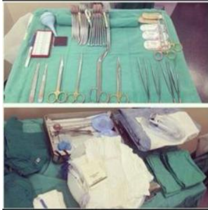
Slika 4.5. Prikaz stola za instrumentiranje i stola za instrumente.

Stol za instrumentiranje i stol za instrumente spadaju u osnovnu opremu bez koje ne bi bilo moguće izvesti nijedan operativni zahvat [4]. Nalaze se u kontroliranom sterilnom području, u blizini pacijenta, kirurga i sterilne medicinske sestre instrumentarke [1]. Stalci i stolovi za instrumentiranje i instrumente za operacijske sobe izrađuju se isključivo od nehrđajućeg čelika s antistatičkim kotačićima i mogu se jednostavno održavati [3] (Slika 4.5).