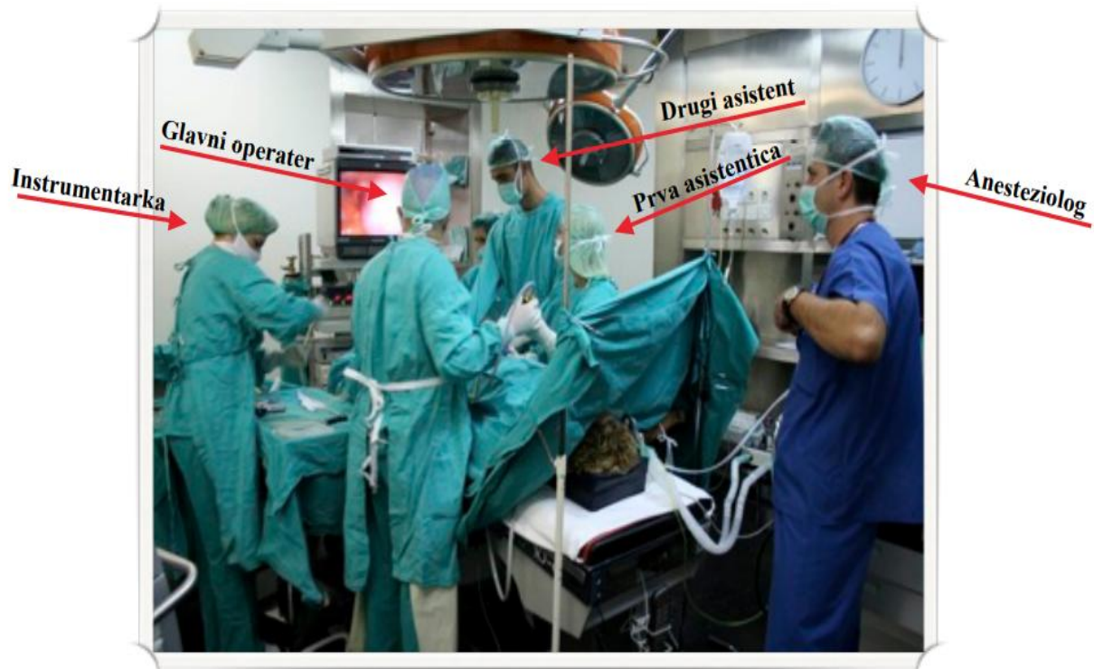
Slika 4.1. Prikaz operacijske sale tijekom ginekološke laparoskopske operacije.

Veličina operacijske sale i svih ostalih pomoćnih prostorija treba biti prilagođena broju osoblja i osigurati njihovo slobodno kretanje s osobitim naglaskom na nesmetanu izvedbu samih operativnih zahvata (Slika 4.1).