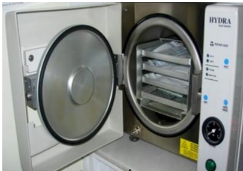
Slika 4.3. Prikaz autoklava.

Autoklav je stroj kojim se provodi fizička metoda sterilizacije kako bi se suzbile sve bakterije, virusi i spore u materijalu (Slika 4.3.) Proces sterilizacije provodi se pomoću pare pod pritiskom. Autoklav sterilizira materijale zagrijavanjem do određene temperature tijekom određenog vremenskog razdoblja, a naziva se i parnim sterilizatorom te se smatra najučinkovitijom metodom sterilizacije jer se temelji na sterilizaciji vlažnom toplinom.