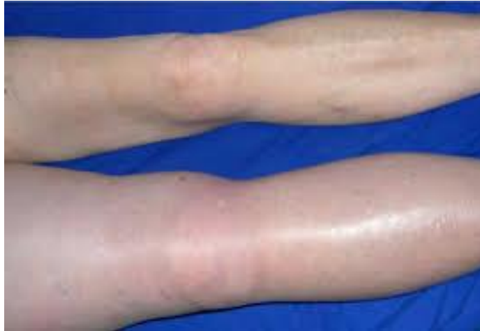
Slika 2. Uočljiva razlika između lijeve i desne noge te prisutnost edema na desnoj nozi.