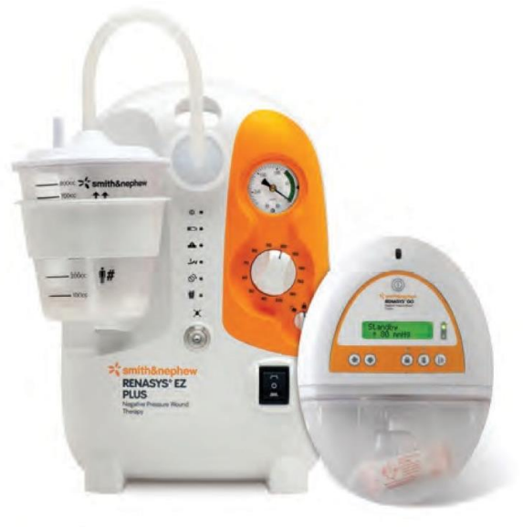
Slika 5.1.4.1 Aparat za terapiju negativnim tlakom

i do potpunog zatvaranja rane. Kontraindicirana je kod rana sa nekrotičnim naslagama i krustama. Aparat za primjenu tlaka (prikazano na slici 5.1.4.1) povlači sekret s površine rane u spremnik, a osim spremnika sastoji se od pumpe, drenažne cjevčice, obloge za ranu od antimikrobne gaze te ljepljive folije koja spaja površinu obloge s drenažnom cijevi (16).