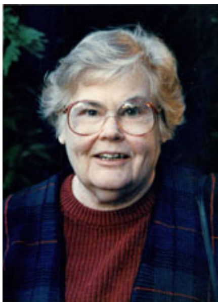
Slika 9.1.1 Dorothy E. Orem

Umrla je 22. lipnja 2007. godine u saveznoj državi Georgiji (15).