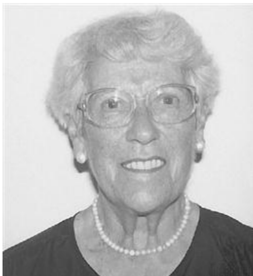
Slika 8.1.1. Nancy Roper

Umrla je 5. listopada 2004. godine (13).