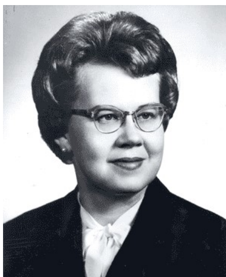
Slika 7.1.1. Dorothy E. Johnson

Nakon završetka školovanja uglavnom se je bavila edukacijom drugih, no radila je i kao medicinska sestra jer ju je to ispunjavalo. Bila je vrlo sretna što se njezina teorija upotrebljava u unaprijeđenu sestrinstva. Njezino najveće zadovoljstvo bilo je gledati uspjehe svojih studenata. Umrkla je u veljači 1999. godine u dobi od 80 godina (12).