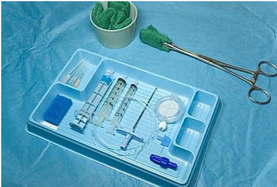
Slika 4.3. Pribor za provođenje epiduralne analgezije

Na slici 4.3. prikazan je potreban sterilan pribor za provedbu epiduralne analgezije.