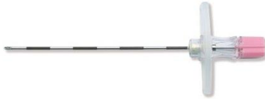
Slika 4.4. Tuohy igla

U slučaju kada se očekuje brzi porod tada se epiduralni kateter postavlja na dubinu od 2 centimetra, a kada se radi o produljenom porodu ili carskom rezu tada se kateter uvodi 6 centimetara u epiduralni prostor (15).