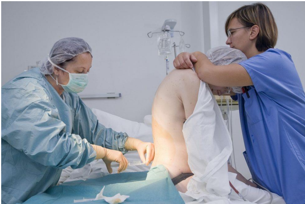
Slika 1.2. Primjena epiduralne analgezije u sjedećem položaju

Danas je najzastupljenija metoda regionalne, lumbalne epiduralne analgezije, a činjenično je kako uz svoju pouzdanost ublažava i prekida porođajni stres i uklanja njegove neželjene posljedice (8).