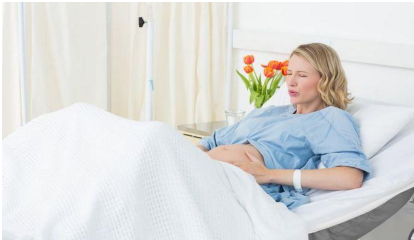
Slika 1.1. Početak trudova i porođajne boli

Važno je napomenuti kako je vještina liječenja boli jedna od najvećih usluga koju liječnici mogu pružiti pacijentu, a unatoč napretku medicine, posebno u granama farmakologije i anesteziologije zastrašujuća priroda bola svedena je na minimum (5).