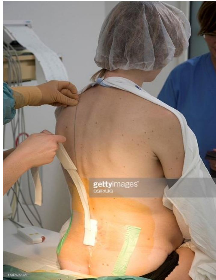
Slika 4.2. Fiksiranje uvedenog katetera za primjenu epiduralne analgezije

uvede igla tada se kroz iglu postavi epiduralni kateter. Za provjeru položaja katetera u epiduralnom prostoru koristi se „test“ doza lokalnog anestetika (12). Ako se nakon provjere zaključi da je kateter na dobroj poziciji tada se njegov preostali dio pričvrsti ljepljivom trakom na leđima, a ulazni dio izvede se uz rame roditelja zbog dostupnosti za primjenu lijekova prilikom poroda (slika 4.2.).