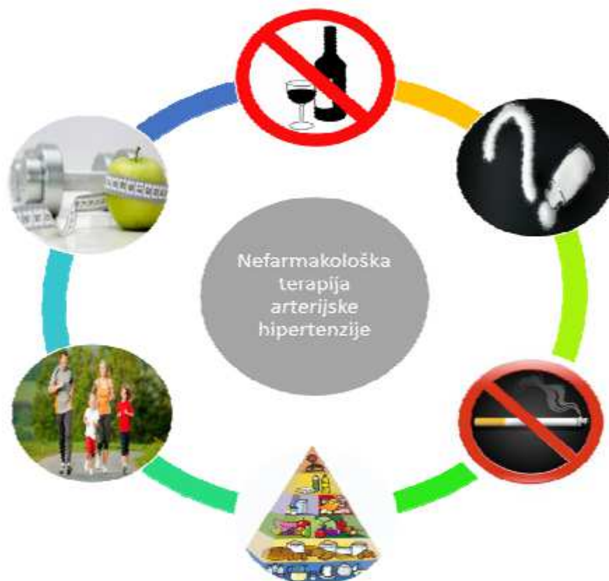
Slika 3. Preporuka liječnika