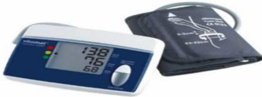
Slika 4 Uređaj za kućno mjerenje arterijskog tlaka.

osobito ako sam nije odlučio rabiti ovu tehniku. Također treba prekinuti s tim načinom mjerenja kada vidimo da to kod bolesnika potiče samostalna i samovoljna upletanja u terapijski plan.