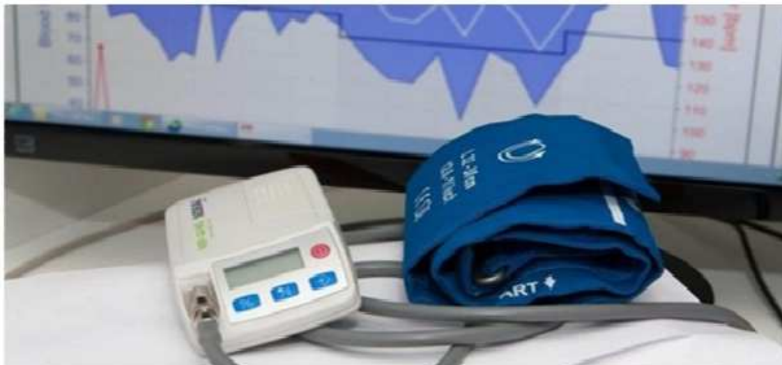
Slika 2. Uređaj za kontinuirano mjerenje arterijskog tlaka.

Sastoje se od monitora koji su većinom oscilometrijski i zasnivaju se na detekciji oscilacija AT-a u orukvici. Maksimalna oscilacija krivulje tlaka pulsa odgovara srednjem AT-u, a sistolički i dijastolički AT-i određuju se s pomoću odgovarajućih formula i računalnih programa. Monitor je gumenom cjevčicom spojen s nadlaktičnom orukvicom (orukvice moraju biti prikladne veličine).