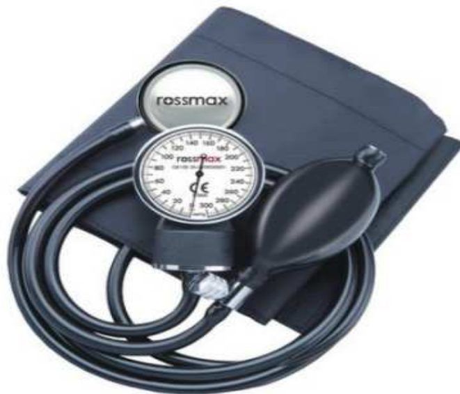
Slika 1. Tlakomjer s manometrom na pero.

Tlakomjer s manometrom na pero u današnje vrijeme je adekvatna zamjena za živin tlakomjer (slika 1). Visoke je kvalitete i preciznosti. Ovaj tlakomjer ima osjetljiv i kompliciran mehanizam te zahtjeva redovito kalibriranje jednom godišnje. Tlakomjer na pero je osjetljiv na udarce te ga je potrebno kalibrirati nakon pada ili ako se njime udari o nešto (7).