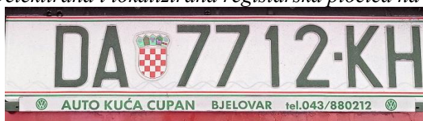
Slika 4. Detektirana i lokalizirana registarska pločica na slici vozila

Sljedeći korak u obradi slike je binarno ograničavanje te invertiranje. Invertiranje će poboljšati pronalazak kontura. Rezultat binarnoga ograničavanja i invertiranja prikazan je na slici 6.