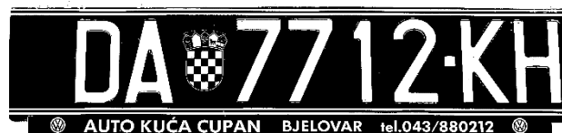
Slika 6. Slika registarske pločice nakon binarnoga ograničavanja i invertiranja slike