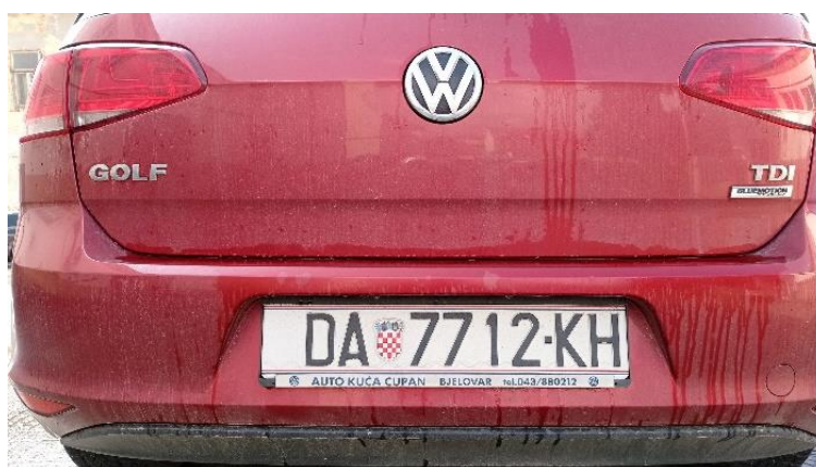
Slika 3. Dohvaćena slika vozila s web kamere koja se prosljeđuje web servisu

Testiranje sustava za prepoznavanje registarskih pločica vozila zasnovanoga na web servisu izvedeno je pomoću web kamere Logitech C920 koja je povezana s Raspberry Pi 4 računalom. Web servis je pokrenut lokalno na stolnom računalu s procesorom Intel i3-10100 te 16 GB RAM memorije. Kroz eksperimente su prikazana dva primjera prepoznavanja registarskih pločica za različita vozila. Raspberry PI računalu na web servis prosljeđuje sliku vozila koja je prikazana na slici 3. Ulazna slika prvo prolazi kroz proces detekcije registarske pločice pomoću platforme TensorFlow.