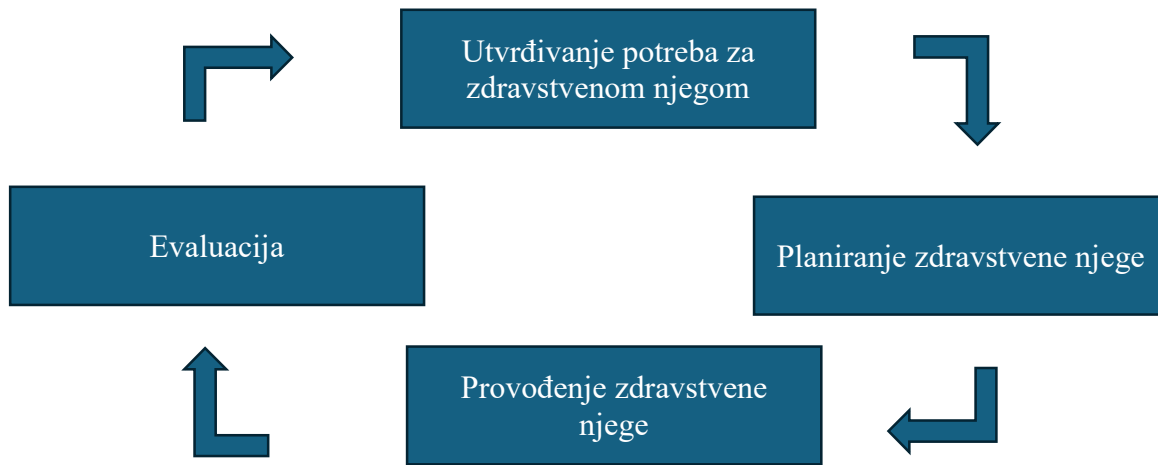
Slika 4. 2. Shematski prikaz faza procesa zdravstvene njege (36)

stvaranje novog pristupa uklanjanja sestrinskog problema (36).