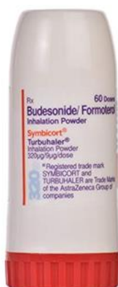
Slika 6.3. Turbuhaler (36)

Svaki aplikator je drugačiji pa je važno znati primjenu za određeni aplikator, kod pumpice spremnik je pod pritisak, a unutar spremnika je lijek skupa s potisnim plinom. Turbuhaler i diskus nemaju plin te oni nisu pod pritiskom. Kako su aplikatori drugačiji, bitna je i pravilna primjena lijeka kako bi se postiglo poboljšanje liječenja.