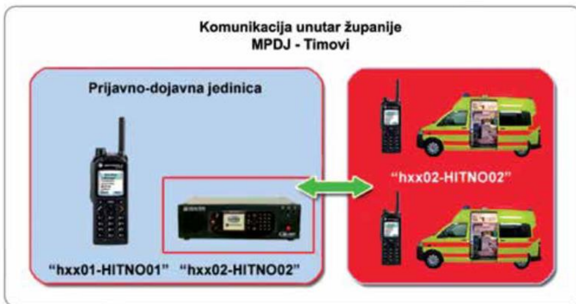
Slika 5.4. Komunikacijski proces između županijske dojavne jedinice i timova hitne pomoći (23)

Prijavno-dojavna jedinica ili dispečer u hitnoj medicinskoj službi poziv o događaju dalje prosljeđuje ispostavama i od strane timova hitne medicinske službe dobivaju povratnu informaciju o zdravstvenom stanju pacijenta i ishodu zbrinjavanja, neovisno je li riječ o ostanku pacijenta u kućnim uvjetima ili transportu u zdravstvenu ustanovu (13).