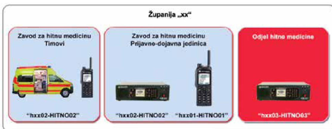
Slika 5.3. Hitna služba unutar županije (23)

Bez obzira o kojemu se radnom mjestu unutar hitne medicinske službe radilo, da li je riječ o medicinsko-prijavno dojavnoj jedinici (MPDJ) ili dispečerskoj službi, objedinjenom hitnom bolničkom prijemu, sanitetskom prijevozu ili timovima hitne medicinske pomoći, komunikacijski su procesi prisutni na različitim razinama kao što prikazuje Slika 1 (13).