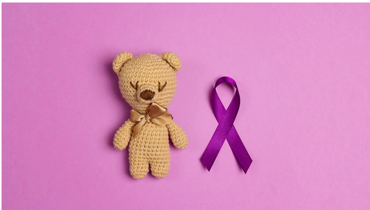
Slika 4.1. Simbol epilepsije (19)

Hrvatska se pridružila obilježavanju Ljubičastog dana još 2010. godine (18). Te godine su održana predavanja i događaji u nekoliko obrazovnih ustanova, što je bio početak kontinuiranog angažmana u podizanju svijesti o epilepsiji. Od samih početaka, u Hrvatskoj su poduzimane različite aktivnosti kako bi se educirala populacija o epilepsiji i potrebi poznavanja osnovnih postupaka (18). Od osmišljavanja i distribucije letaka do organiziranja velikih javnozdravstvenih akcija poput „Bicikliraj za epilepsiju!“, poruka Cassidy Megan se neprekidno širi, pružajući podršku osobama s epilepsijom i podižući razinu svijesti o ovoj bolesti (18). Tijekom godina, u obilježavanje Ljubičastog dana uključile su se brojne ustanove i institucije, kao što su osnovne i srednje škole, vrtiće, fakultete te bolnice. Ova manifestacija dobila je značajnu podršku javnosti i zapaženost medija. U organizaciju su se tijekom vremena uključila sva relevantna stručna društva i udruge iz područja epilepsije, poput Hrvatske udruge za epilepsiju, Hrvatske lige protiv epilepsije i drugih stručnih udruga te zdravstvenih ustanova koje pružaju podršku oboljelima od epilepsije (18). Ljubičasta boja se koristi za podizanje svijesti o epilepsiji, dok je ljubičasta vrpca njen simbol (19).